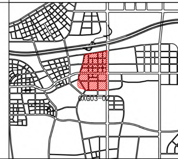
开发单元四至和面积

XXFX-CXG03-02开发单元位于沣西新城南部科学城片区，北至科创谷二路、南至CXG东北二十路、东至CXG东北一路、西至咸户路，总面积114.60公顷（约1719.00亩）。